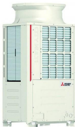
Fig. 1 – Impianto oggetto dell'intervento

UTA-Protect® è il sistema appositamente studiato e prodotto dalla SILTE per insonorizzare gruppi frigoriferi, pompe di calore, chiller, etc. Il dispositivo viene realizzato su misura e configurato per lo specifico impianto da isolare, nel Vs. caso 1 pompa di calore MITSUBISHI modello PUHY-P250YNW -A1 . Il dispositivo fornisce un valore di isolamento acustico medio fino a 15 dB. UTA-Protect® viene normalmente installato su impianti appoggiati a terra, per gli impianti installati a parete o su grigliati forati è disponibile un kit opzionale di chiusura inferiore. Dove non è presente un adeguato basamento di appoggio quest'ultimo dovrà essere predisposto dal Cliente. L'accesso agli impianti sarà garantito dai pannelli asportabili per le ordinarie operazioni di controllo e manutenzione. Telaio e pannelli sono realizzati in alluminio anodizzato fino alle taglie medie, per impianti di grossa taglia la struttura portante viene realizzata in acciaio zincato a caldo. La pannellatura può essere verniciata in colorazione su richiesta con sovrapprezzo. Prima della realizzazione sarà sottoposto il progetto esecutivo per l'approvazione. Il materiale viene fornito in kit di montaggio. Dimensioni singolo impianto: (AxLxP) h. 1.858 x 920 x 740 mm